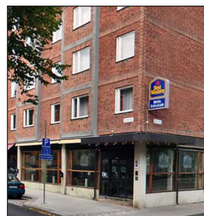
Hotel Esplanade håller hög standard och receptionen har öppet dygnet runt.