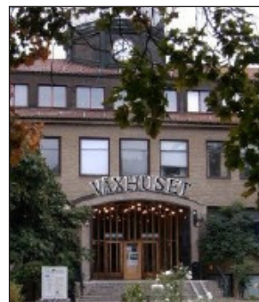
Växhuset, där turneringen spelas, är ett kulturcentrum beläget mitt i stan, precis bredvid spelarhotellen.